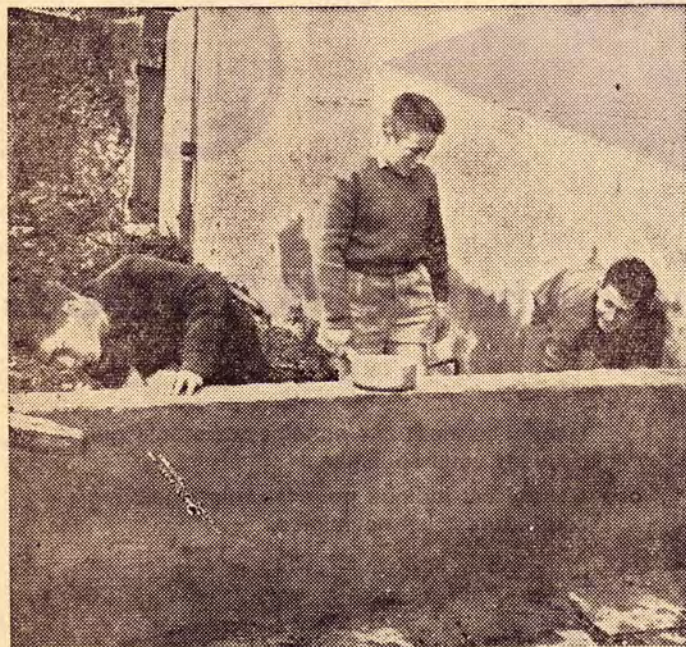
DES SCOUTS AU TRAVAIL

Au fonds du jardin du collège de Combrée, il y a un vieux lavoir et deux petits bâtiments : l'un qui servait de buanderie, bâtiment ancien remanié au cours des temps, mais dont la charpente fixe l'époque, et un autre plus récent qui avait été construit pour les sportifs.