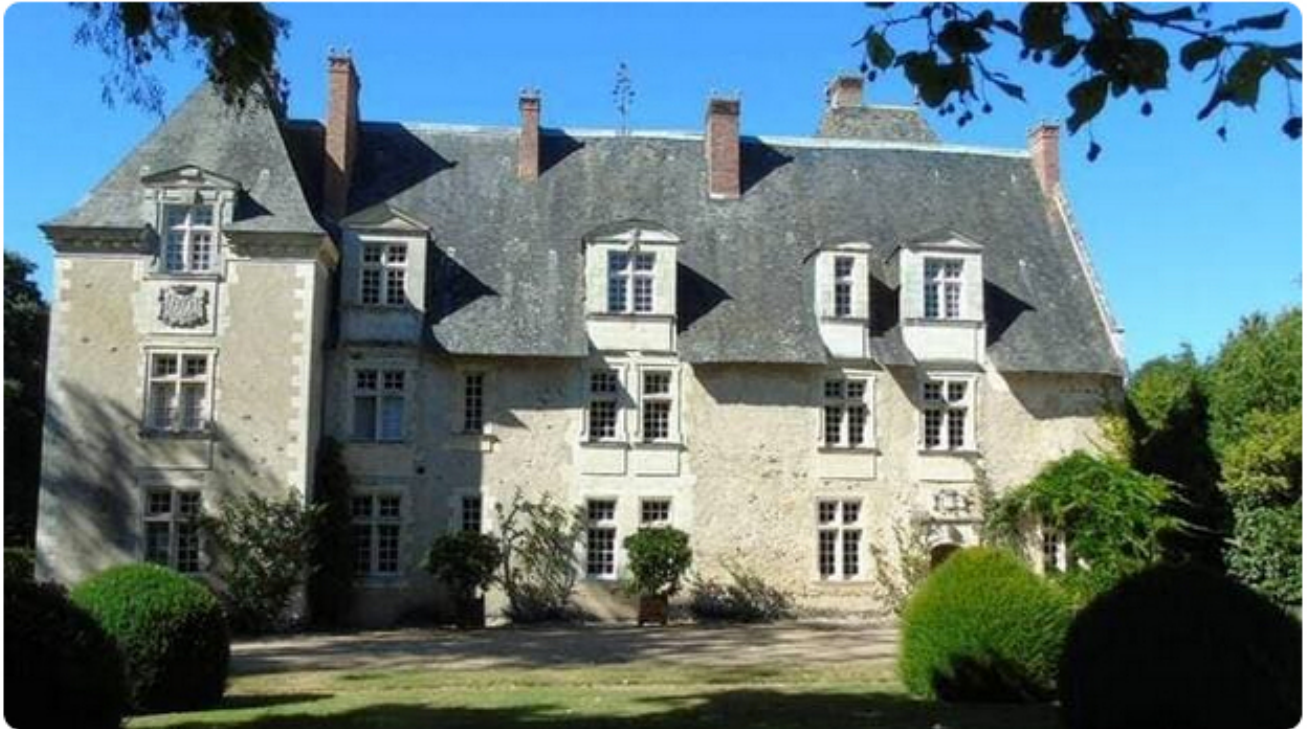
Propriété de João Cardoso depuis 2019, le château de Raguin à Chazé-sur-Argos est à vendre.

Si le château de Falloux, au Bourg-d'Iré, a récemment trouvé un nouveau propriétaire, un autre édifice ancien est en vente depuis peu dans le Segréen (Maine-et-Loire) : le château de Raguin à Chazé-sur-Argos.