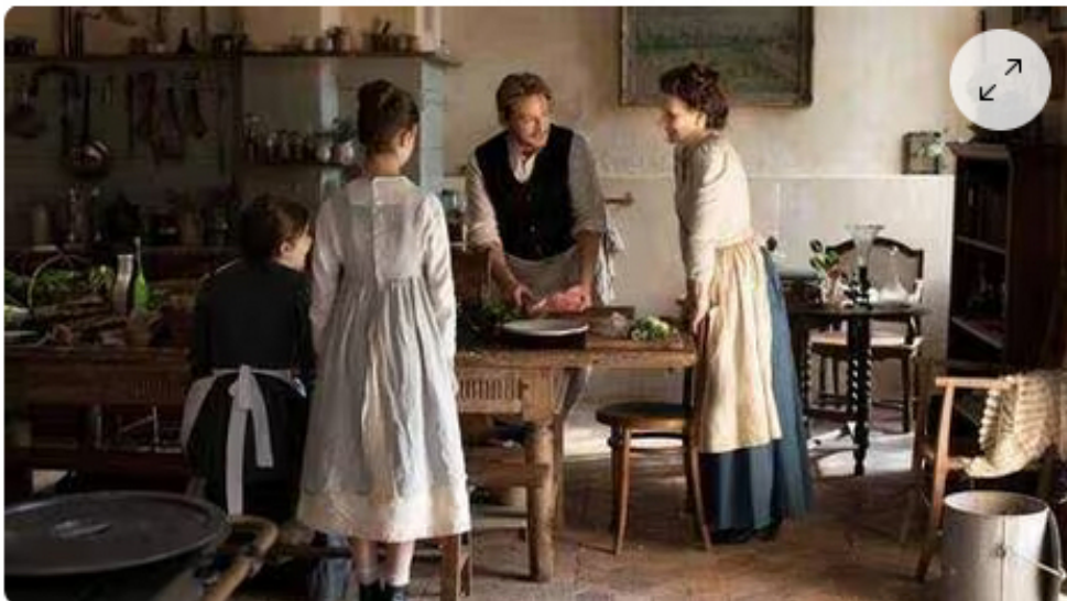
La cuisine du château de Raguin a été le théâtre de nombreuses scènes du film La passion de Dodin Bouffant avec Benoît Magimel et Juliette Binoche.

Plus discret, situé à l'abri des regards, la demeure a été mise en lumière grâce au tournage du film La passion de Dodin-Bouffant , au printemps 2022.