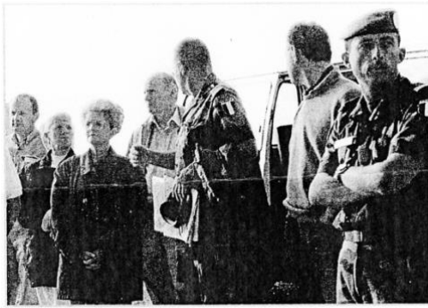
Liban sud 2001 • Naqoura

Je conserve le souvenir de visites qu'elle avait organisées au Palais du Luxembourg et au Palais Bourbon. Ces expériences concrètes faisaient partie intégrante de son enseignement : ouvrir les horizons de ses élèves et leur permettre de mieux appréhender le fonctionnement des institutions et de la démocratie.