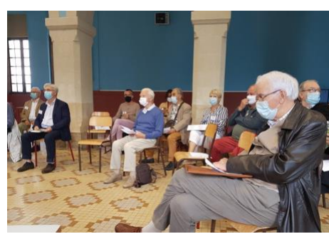
L'étude des moyens

La presse a parlé de la Fête des Anciens et de la Journée du Patrimoine