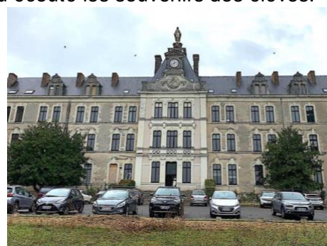
Des voitures d'anciens élèves