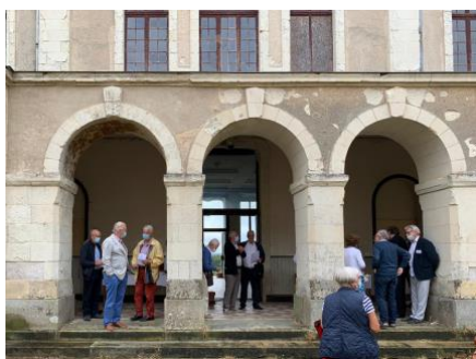
Cloître et hall d'entrée