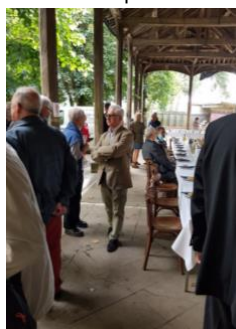
Le préau de la cour Ouest